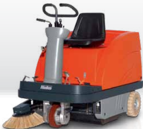
Sweepmaster B900 R