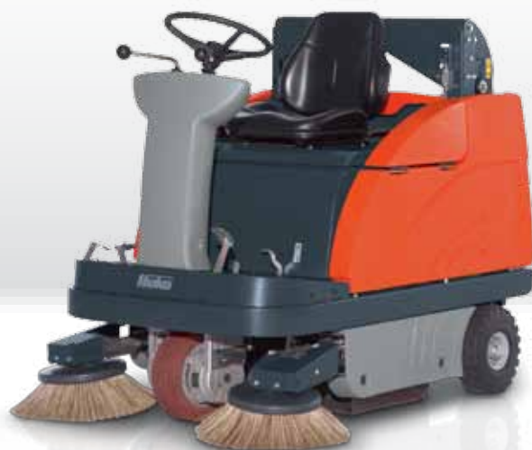
Sweepmaster B980 RH